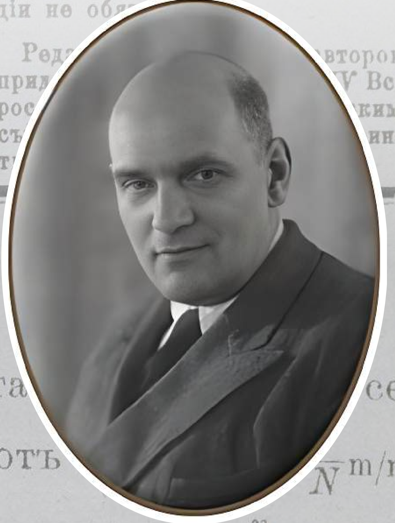
Историк Борис Фёдорович Поршнев